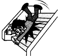
階段から落ちてケガ