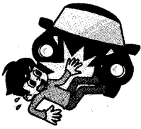
交通事故によるケガ

国内・国外を問わず、工作中、日常生活中やレジャー中などにおけるさまざまな事故によるケガを補償します。