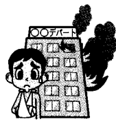
建物の火災・倒壊などによるケガ など